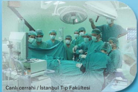
Canlı cerrahi / İstanbul Tıp Fakültesi